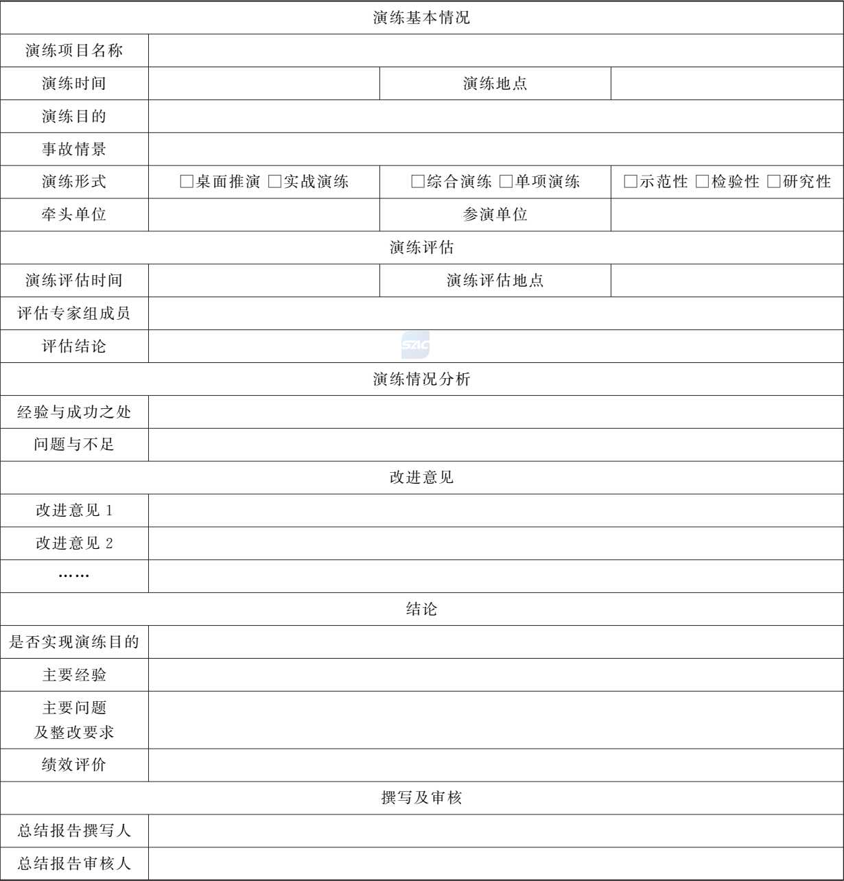
表 B.5 应急演练总结报告参考模板